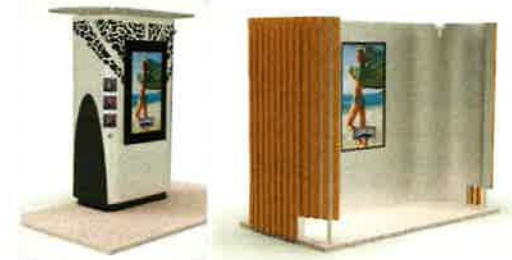
Différents visuels de la douche AQUASPOT

Ce produit, s'il s'étend et donne des résultats concluants, pourrait permettre de retrouver le confort des douches de plage pour les touristes, douches qui ont été largement remplacées par des rince-pieds par souci d'économies d'eau.