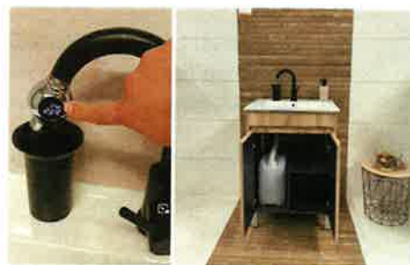
Système de récupération d'eau d'évier LAURENTABLE

au-dessous du tuyau dépassant de l'évier et directement relié au réservoir.