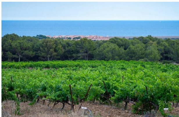
Les vignes de Gruissan face à la mer Méditerranée, sous la chaleur estivale

et les aider à raisonner leurs pratiques pour inscrire l'irrigation dans une gestion durable de la ressource. Si le projet Irri-Alt'Eau s'avère concluant, il pourrait inspirer d'autres territoires méditerranéens et contribuer à accélérer la place de la réutilisation de l'eau dans les politiques françaises.