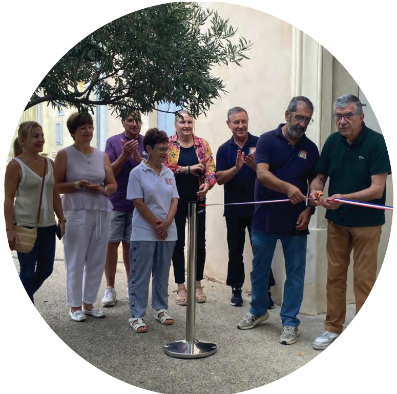
Inauguration de la Maison des Associations