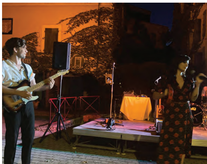
Soirée Jazz - 9 juillet 2025