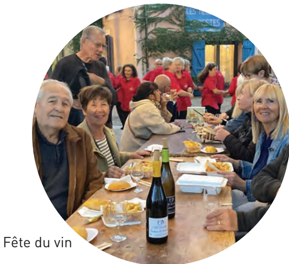
Fête du vin