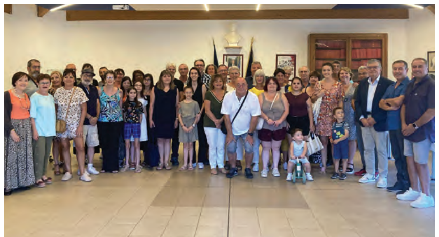
Accueil des nouveaux Bassanais