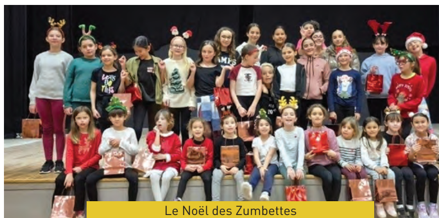
Le Noël des Zumbettes