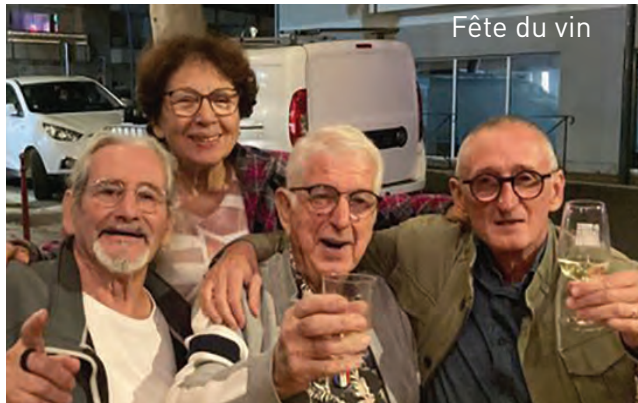
Fête du vin