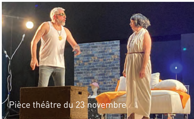
Pièce théâtre du 23 novembre