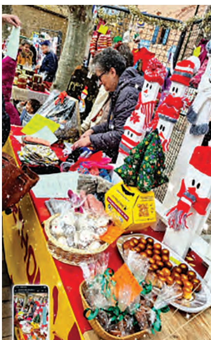
2120€, record à battre!