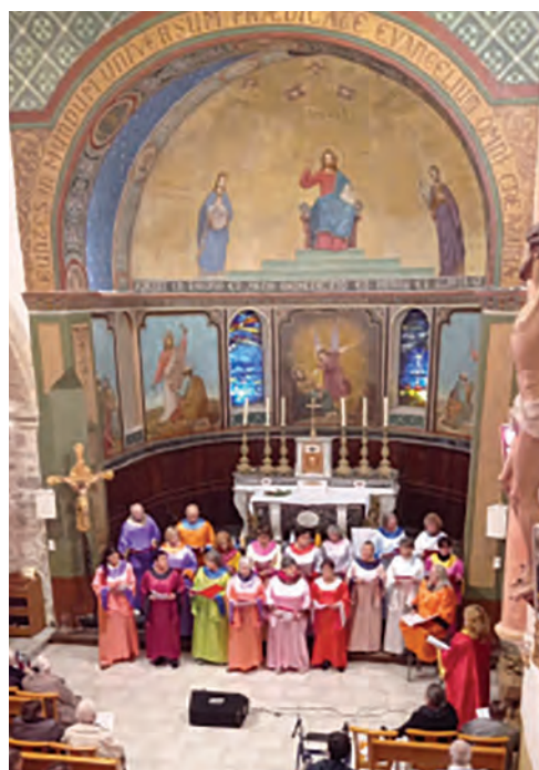
Chorale à St-Pierre aux Liens