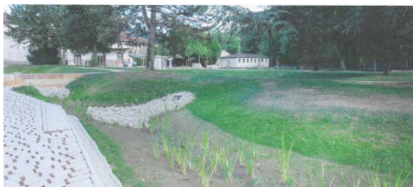
Le parc municipal agrémenté de jardin de pluie

En parallèle, 2,9 km de réseaux ont été séparés sur trois communes, améliorant la qualité de l'eau et la résilience du territoire face au changement climatique.