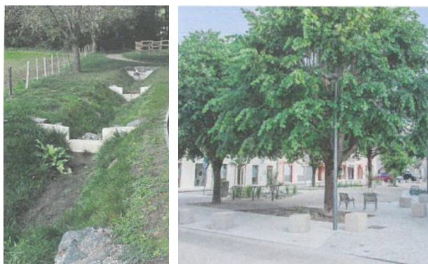
A gauche : La nouvelle noue à seuils favorise la régularisation des eaux pluviales et tempore leur impact A droite : La place du Centre recouverte d'un sol perméable